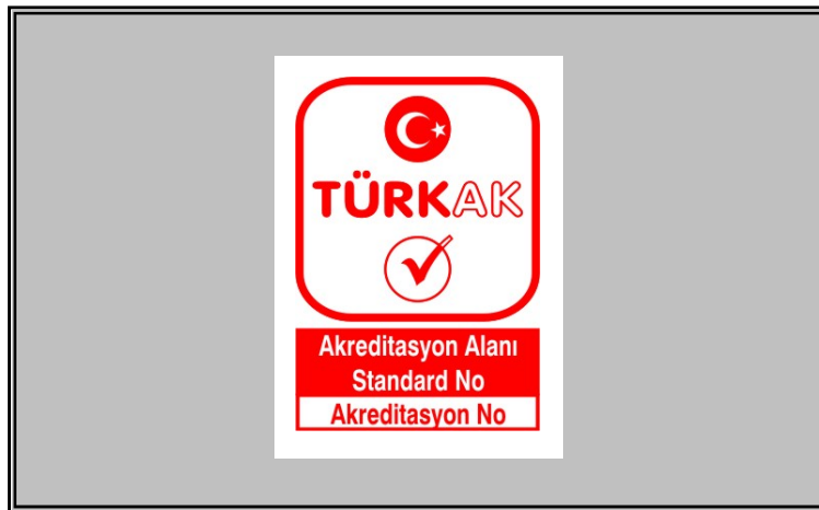
Şekil 3: TÜRKAK Akreditasyon Markasının beyaz zeminli dokümanlar haricindeki dokümanlarda kullanım şekli