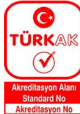
Şekil 2: TÜRKAK Akreditasyon Markası

TÜRKAK Akreditasyon Markası: TÜRKAK tarafından akredite edilmiş kuruluşların akreditasyon statülerini göstermek için kullandığı semboldür. Akreditasyon Markası TÜRKAK logosunun altına akreditasyon alanı, akreditasyona konu olan standardın numarası ve akredite edilmiş kuruluşun akreditasyon numarasının eklenmesi ile oluşturulur.