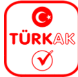
Şekil 1: TÜRKAK Logosu

TÜRKAK Logosu: TÜRKAK'ın kendi ismini veya akreditasyon programlarını tanıtmak için kullandığı sembol